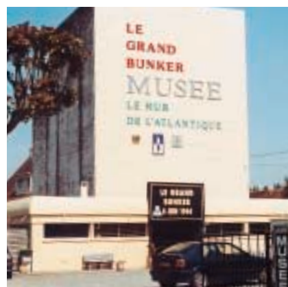
Musée du Mur de l'Atlantique à Ouistreham : dans un ancien poste de tir, le grand bunker domine l'embouchure de l'Orne.