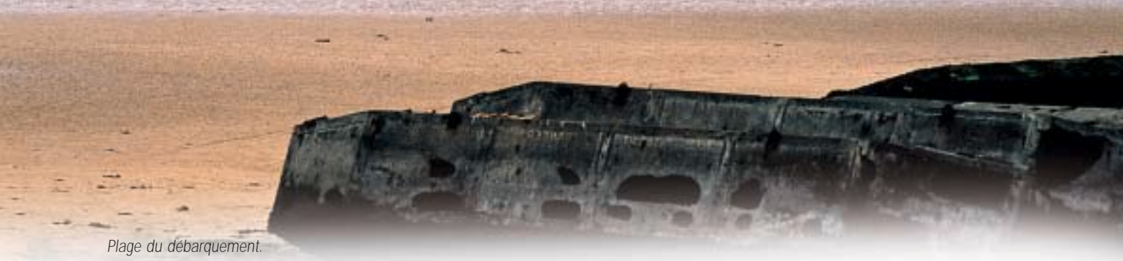
Plage du débarquement.