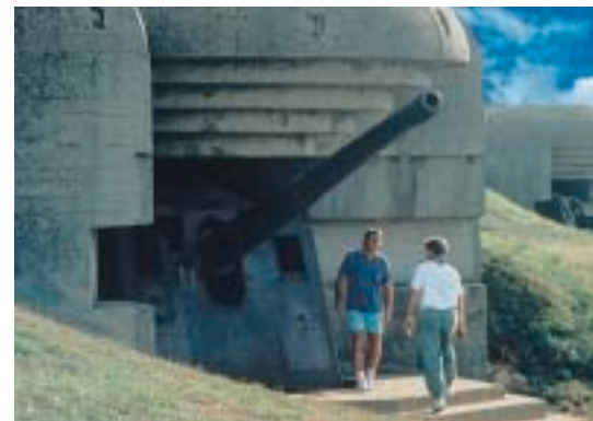
Batterie de Longues-sur-Mer.

A cette date, prend fin la bataille de Normandie.