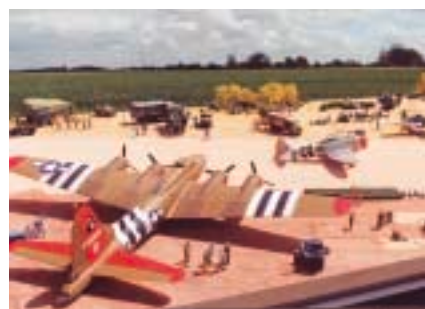
America Gold Beach à Ver-sur-Mer : tête de pont britannique le 6 juin 1944.

Das Eintreffen der 6. britischen Division auf der Pegasus Bridge, der ersten befreiten Brücke Frankreichs.