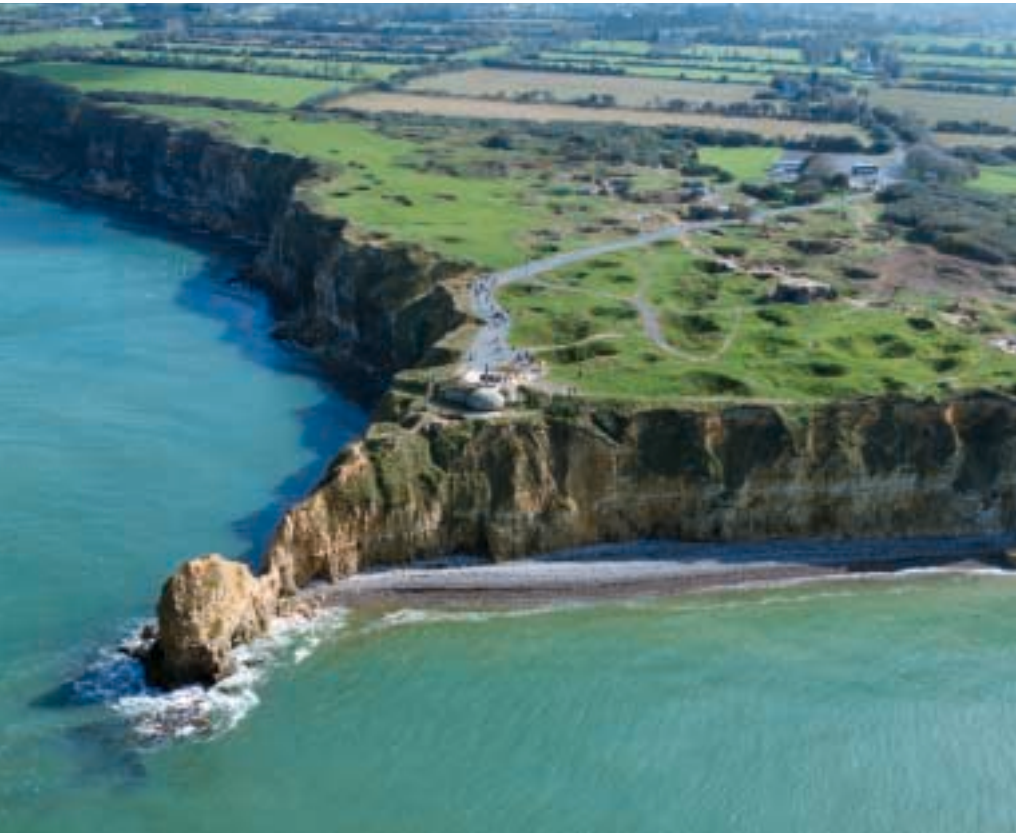
Pointe du Hoc.

The decision by Roosevelt and Churchill to attempt a landing in France goes back to the beginning of 1943.