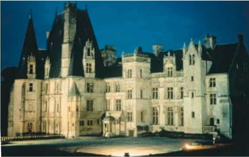
Fontaine-Henry : chateau Renaissance, mobilier (XVI e - XVIII e s.).

Châteaux, manoirs, fermes fortifiées, abbayes... A découvrir de nuit avec le "Festival de lumières". Castles, manor houses, fortified farms, abbey churches... Schlösser, Herrenhäuser, befestigte Bauernhöfe, Abteien.