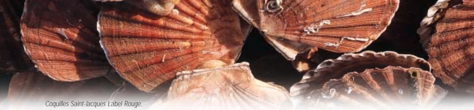
Coquilles Saint-Jacques Label Rouge.