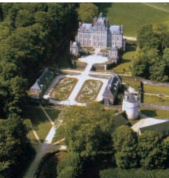
Château de Balleroy : musée des Ballons.