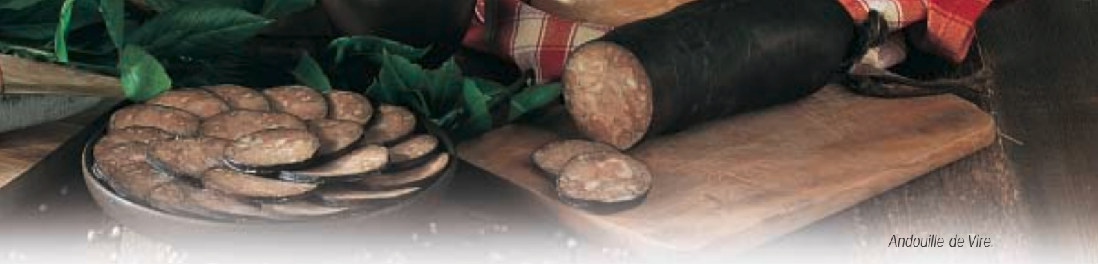
Andouille de Vire.