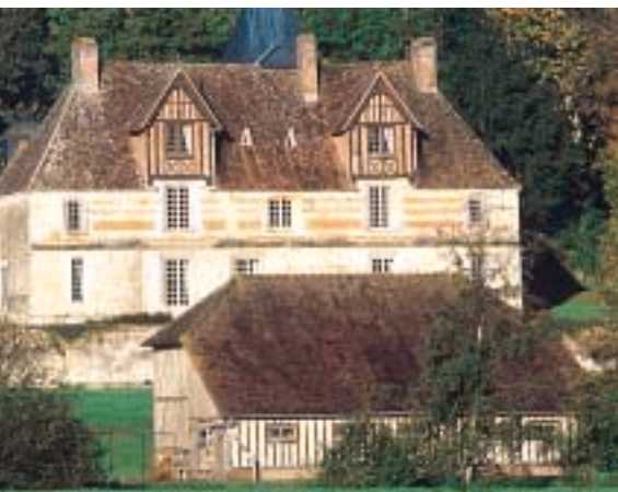
St-Martin-de-la-Lieue : manoir St-Hippolyte.

Haras, manoirs, petites églises et chaumières à colombages. A découvrir en nocturne : le circuit "Pierres, eaux et lumières en Pays d'Auge". Stud farms, manor houses, little churches and thatched timbered cottages dot the landscape. Gestüte, Herrenhäuser, kleine Kirchen und Strohdachhäuser mit Fachwerk.