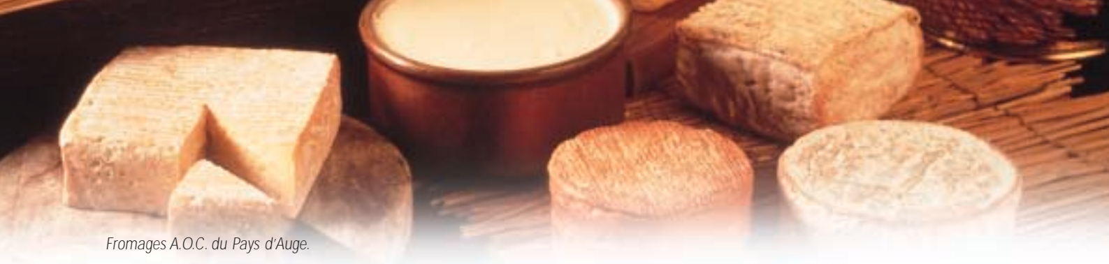
Fromages A.O.C. du Pays d'Auge.