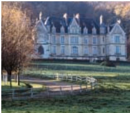
Au château de Betteville, la belle époque automobile. Fine vintage cars. Schloss Betteville, Autos aus der Belle Epoque.