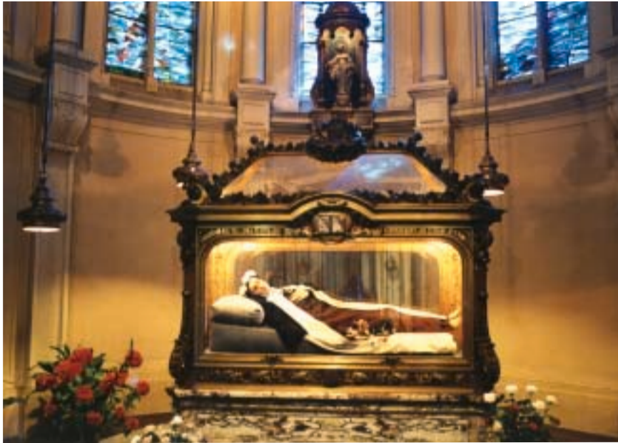
Reliques de sainte Thérèse transférées en 1923 dans la chapelle du Carmel. In 1923 St Theresa's relics were placed here. Reliquien der Heiligen Theresia (seit 1923).