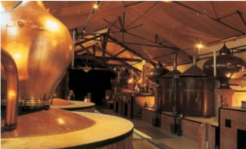
A la ferme ou chez les grands producteurs, visitez les distilleries de calvados ! Distilleries large and small. Besuchen Sie die Calvados-Distillierien.