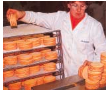
A Livarot, la fromagerie Graindorge. Cheese-making at Livarot. Die Käserei Graindorge in Livarot.