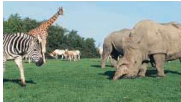
Site zoologique : plus de 300 animaux dans un magnifique cadre naturel de 50 hectares. 125 acres for animals to roam free for our enjoyment. 50 ha für die Tierwelt.