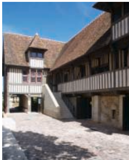
A Pont-l'Évêque. 16th c. Dominican convent. Dominikanerinnenkloster (XVI. Jh.)