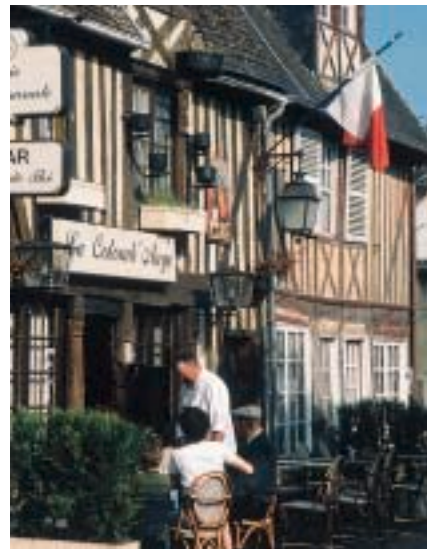
Beuvron-en-Auge, Beaumont-en-Auge, Cambremer. Typical villages Typische Dörfer.