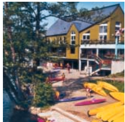
Canoë-kayak, guinguettes, circuits pédestres ou V.T.T (labellisés F.F.C.). Walking, biking, canoeing... Kanu, Tanzlokal, Wander- und Radwege.