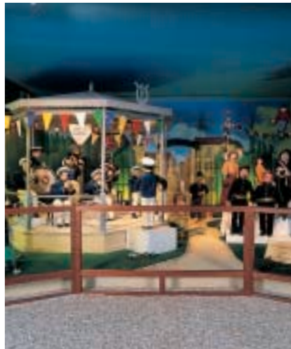
"Automates Avenue", une réalisation insolite et fabuleuse (300 automates). Both unusual and unreal - 300 automats. Ein märchenhaftes Museum (300 Automaten).