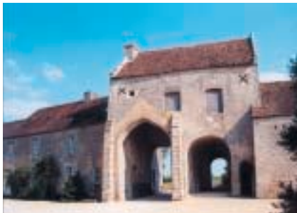
Ruines de l'abbaye cistercienne fondée en 1127 par des moniales. Cistercian abbey founded in 1127. 1127 gegründete Zisterzienserabtei.