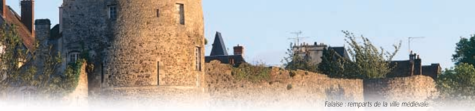
Falaise : remparts de la ville médiévale.