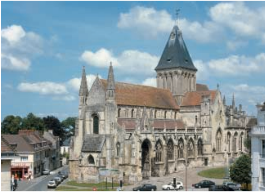
Des églises monumentales pour un cours d'histoire de l'art (XI e , XII e et XV e s.). A whole chapter of art history is written into these monumental churches. Gewaltige Kirchen aus dem XI., XII. und XV. Jahrhundert. Interessante Kunstgeschichte.