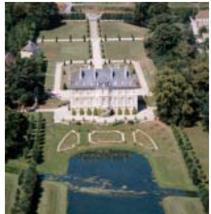
Château du XVIII e s., collection de mobilier miniature. Jeux d'eau surprises dans le parc. Miniature furniture, Surprising fountains. Schloss aus dem XVIII. Jh., Miniaturmöbel. Wasserspiele im Park.