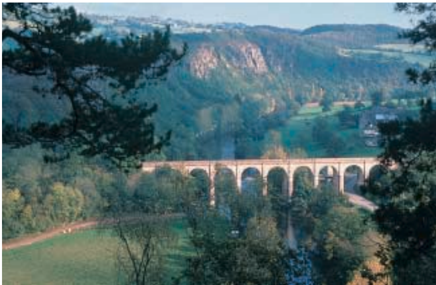
La vallée de l'Orne, les rochers des Parcs et la forêt de Grimbosq. Valleys, rocks and forests... Das Ornetal, Felsen, der Wald von Grimbosq.