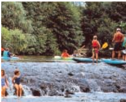
Petites cités de caractère labellisées "Stations vertes de vacances".

Bases de canoë-kayak. All your open-air activities. Center für Kanu Kajak und Sport im Freien.