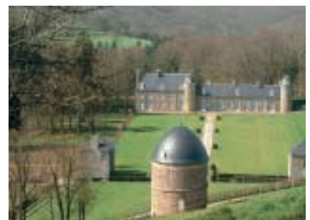
Château (XVI e et XVIII e s.) et musée. Beau parc dans un site magnifique. A chateau and museum in lovely grounds. Schloss und Museum. Herrlicher Park in wun- derschöner Lage.