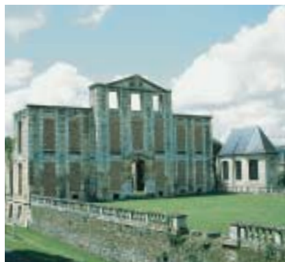
Autour des ruines du château, parc boisé et jardins fleuris. Amid trees and flowers, a ruined castle. Schlossruine mit Park und Gärten.